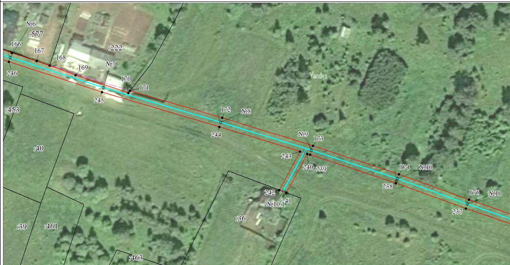
План границ объекта