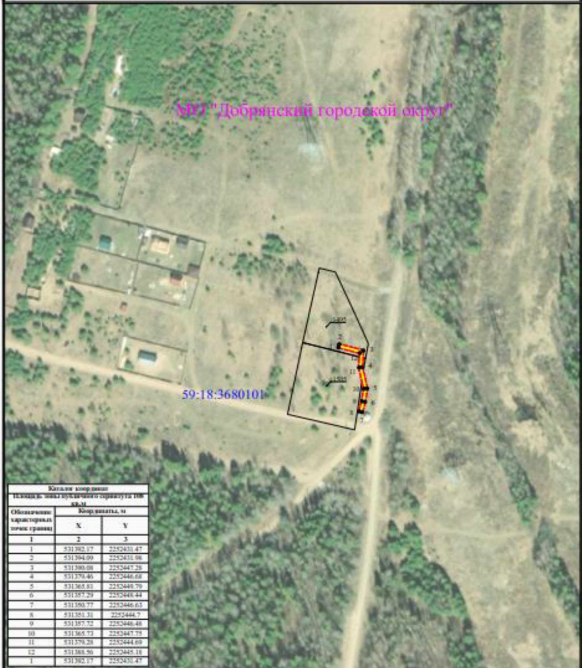
Схема расположения границ публичного сервитута для эксплуатации объекта КЛ-0,4 кВ ф.1 от КТП № 10421