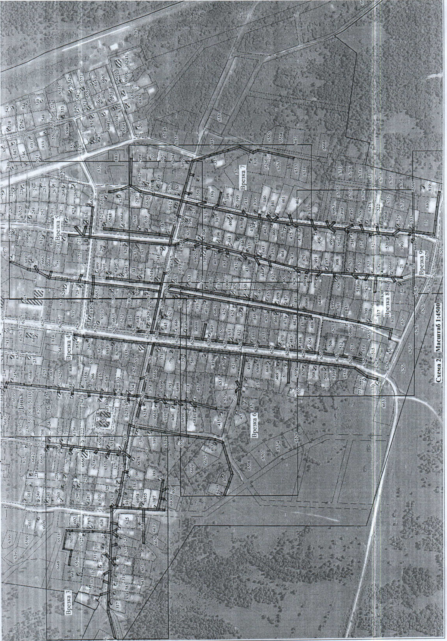
Схема 2 Масштаб 1:4500