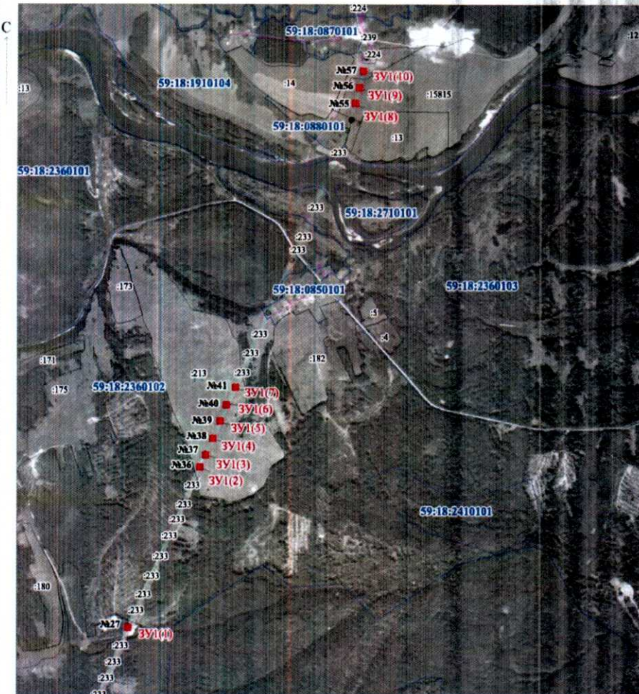
МСК-59, зона 2

от т.н37 до т.н37 - земельный участок с кадастровым номером 59:18.1910104:13 (входит в состав ЕЗ с кадастровым номером 59:18.0000000:159).