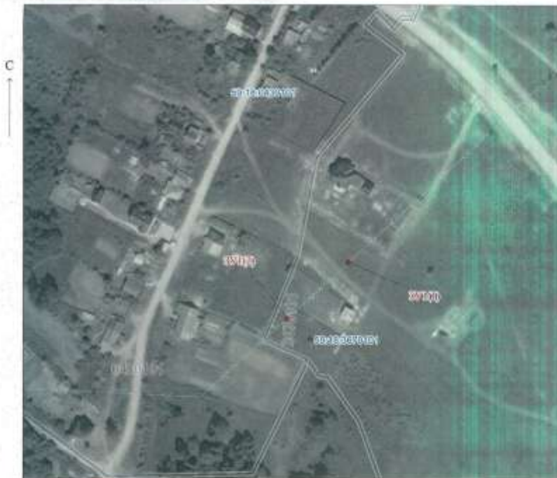
МСК-59, зона 2