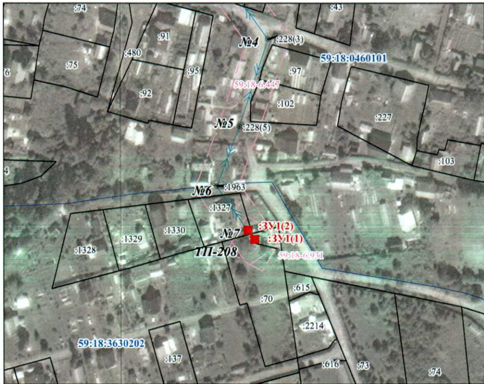
МСК-59, зона 2

от т.н5 до т.н5 - земельный участок с кадастровым номером 59:18:3630202:70.