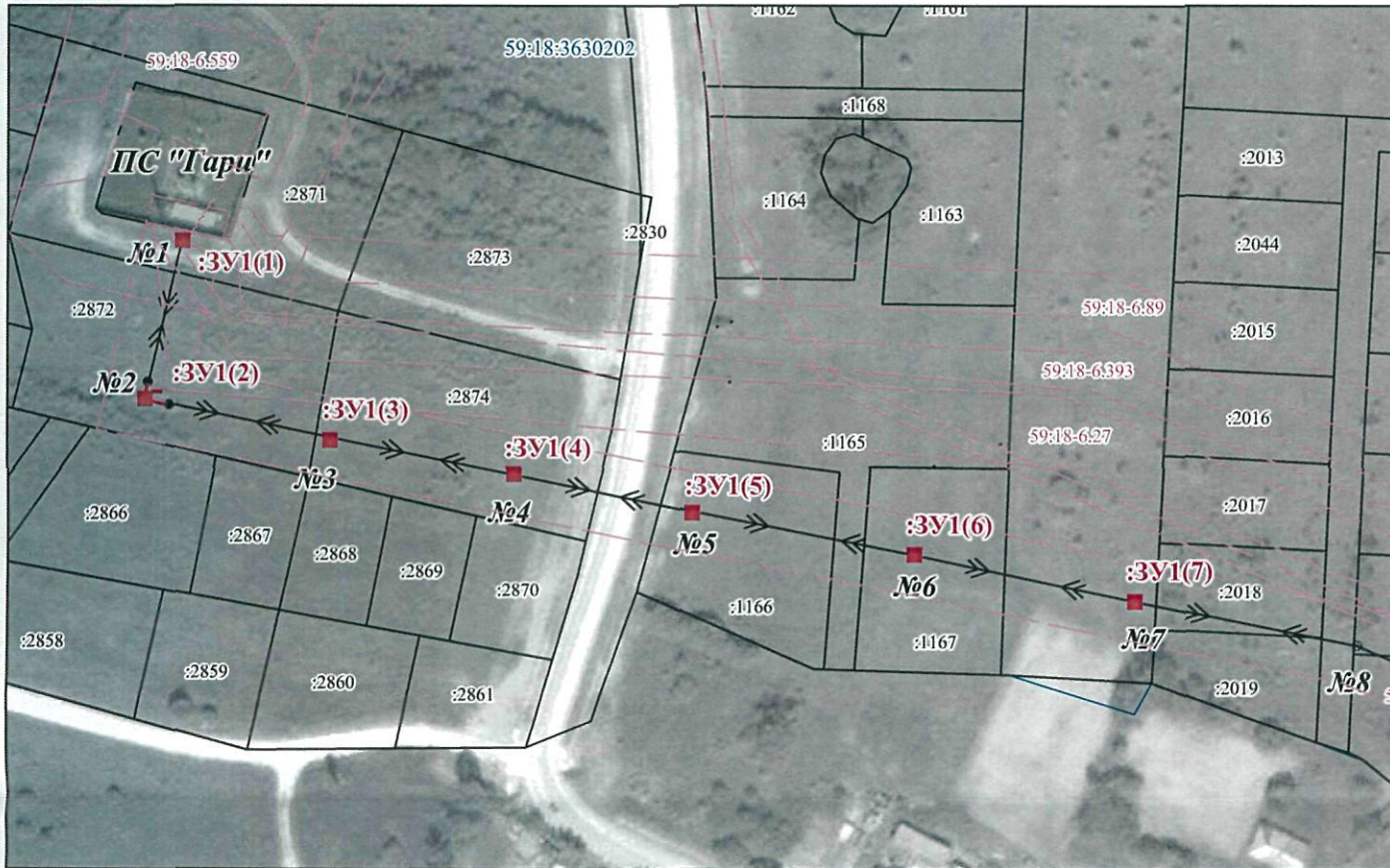
МСК-59, зона 2

от т.н1 до т.н1 - земельный участок с кадастровым номером 59:18:3630202:2871; от т.н5 до т.н5 - земельный участок с кадастровым номером 59:18:3630202:2872; от т.н11 до т.н11, от т.н15 до т.н15 - земельный участок с кадастровым номером 59:18:3630202:2874; от т.н19 до т.н19 - земельный участок с кадастровым номером 59:18:3630202:1166; от т.н23 до т.н23 - земельный участок с кадастровым номером 59:18:3630202:1167; от т.н27 до т.н27 - земельный участок с кадастровым номером 59:18:3630202:227.